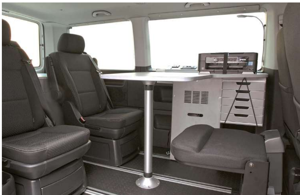
Versione con sedile operatore richiudibile, cassettera integrata nella scrivania e sedili singoli originali su guide.