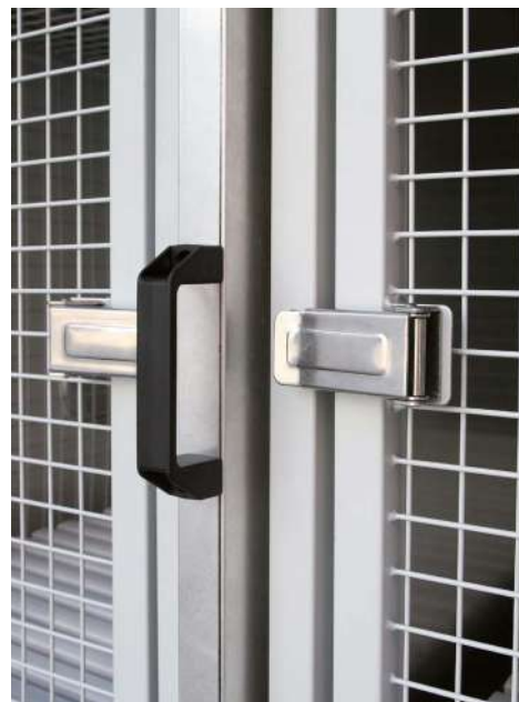
Chiusura delle gabbie e parete divisoria estraibile