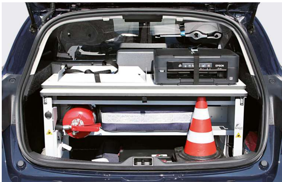
Vano Tecnico Basic: versione con supporto etilometro e stampante