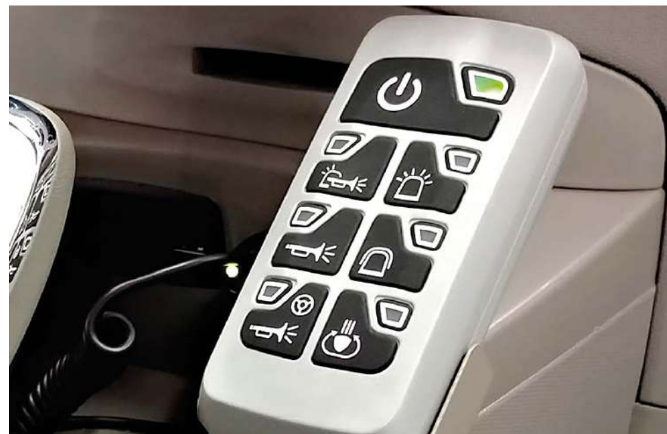
Pratica pulsantiera di comando integrata