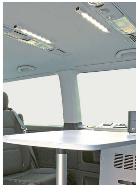
Plafoniere di illuminazione a LED