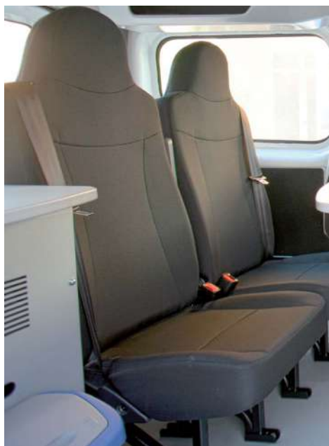
Sedili omologati M1

ALLESTIMENTO COMPATIBILE CON: Fiat Talento, Ford Tourneo Custom, Mercedes Classe V, Nissan NV200, Opel Vivaro, Renault Master