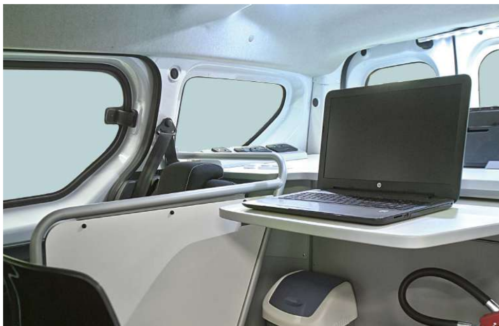
Scrivania integrata in sostituzione della cappelliera, con piano scrittoio estraibile e cassetto porta documenti