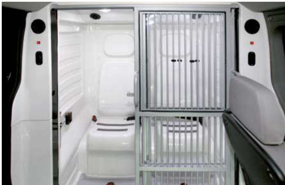
Cellula di detenzione su furgone

La cellula di detenzione è composta da paratia divisoria trasparente antisfondamento, pannellature laterali, pavimentazione e sedili in materiale plastico o vetroresina per una facile igienizzazione.