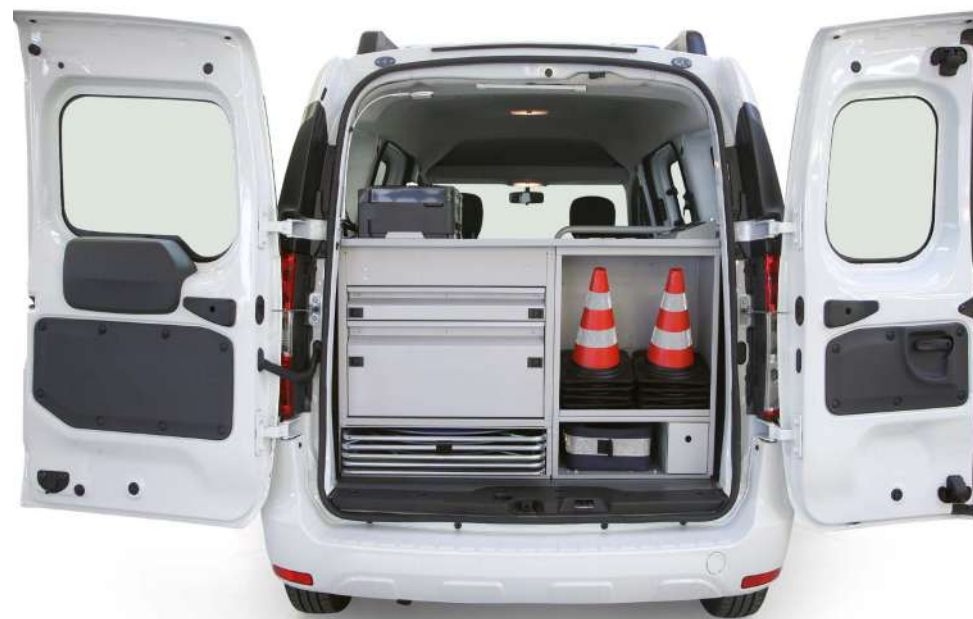
Vano tecnico realizzato su misura per il posizionamento di equipaggiamenti e attrezzature