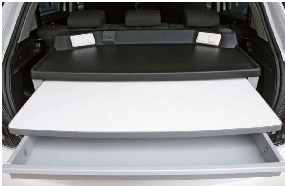
Cassetto porta documenti