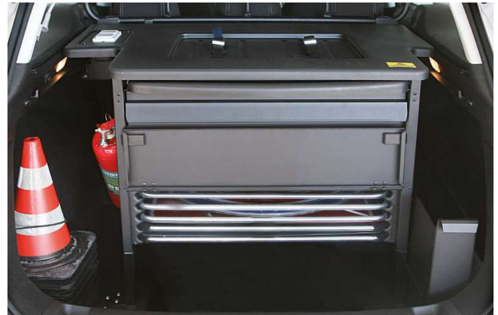
Cassetto per segnaletica autoportante e vano alloggiamento valigette rilievo incidenti in ABS termoformato