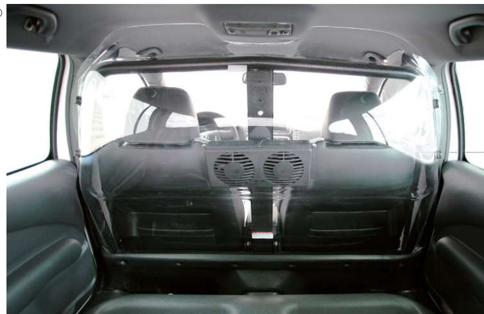
Cellula di detenzione su vettura: paratia divisoria trasparente con sistema di areazione