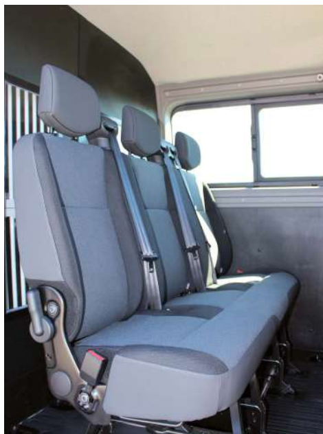
Sedute per 3 operatori

Le porte battenti posteriori sono appositamente dotate di una coppia di finestrini con vetro scorrevole ricoperti da una griglia di protezione.