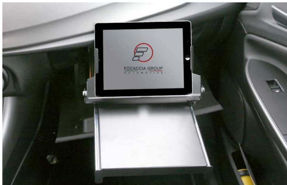
Supporto tablet estraibile a scomparsa

Per stile e funzionalità spicca il trunk organizer con vani per giubbotti antiproiettile, kit alta visibilità, accessori vari, valigetta rilievo incidenti.