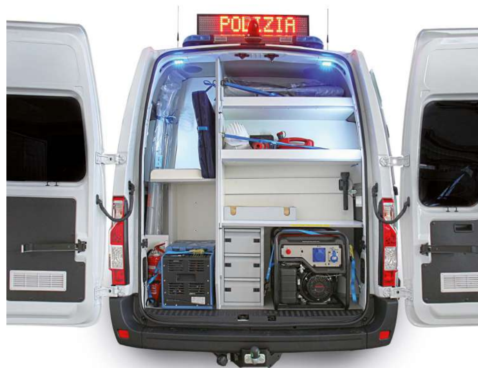
Vano tecnico realizzato su misura per il posizionamento di equipaggiamenti e attrezzature

ALLESTIMENTO COMPATIBILE CON: Citroën Jumper, Fiat Ducato, Ford Transit, Mercedes Sprinter, Nissan NV400, Opel Movano, Peugeot Boxer, Renault Master