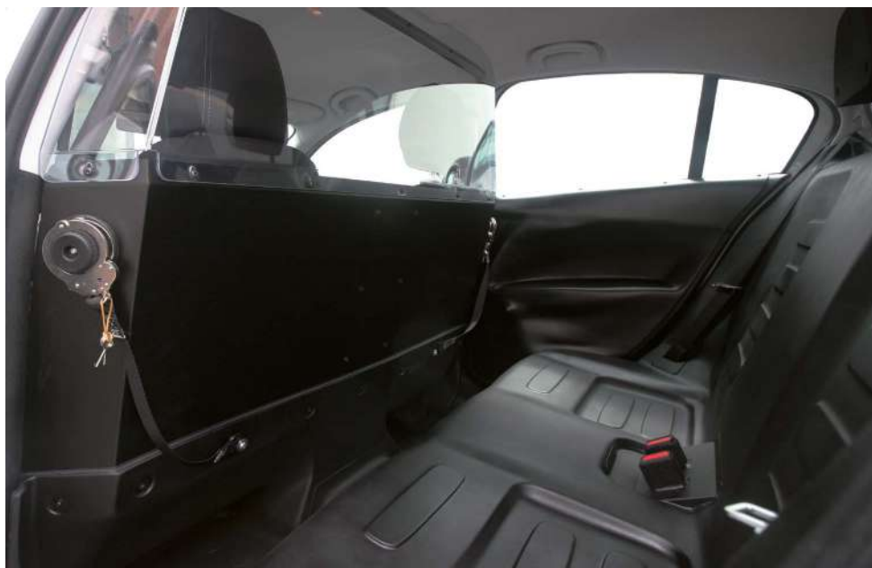
Cellula di detenzione: pannellatura sportelli, divanetto in ABS termoformato e anelli di ammanettamento