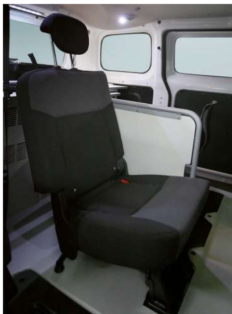
Posto viaggio con paratia divisoria

ALLESTIMENTO COMPATIBILE CON: Citroën Berlingo, Dacia Dokker, Fiat Doblò, Mercedes Citan, Nissan Evalia, Opel Combo, Peugeot Partner, Renault Kangoo, Volkswagen Caddy