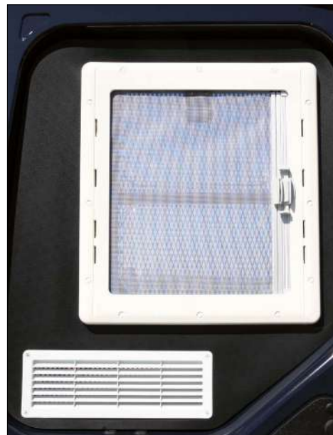
Finestrino apribile e griglia d'aerazione su porte posteriori