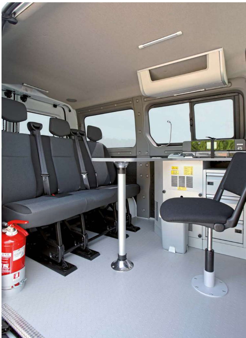
Postazione operatore con scrivania dotata di leggimappa e kit energy, cappelliera in ABS e plafoniera LED