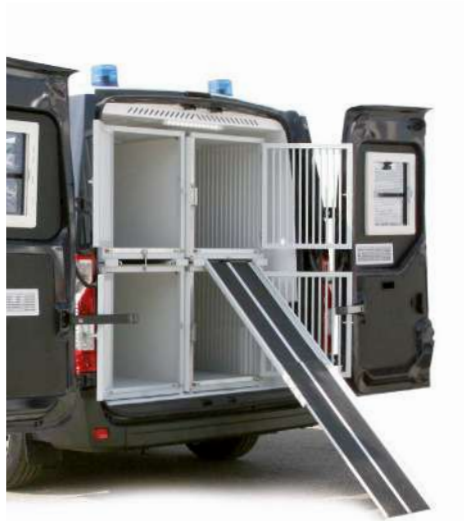
Pedana/scivolo estraibile per l'ingresso e l'uscita degli animali dalle gabbie superiori