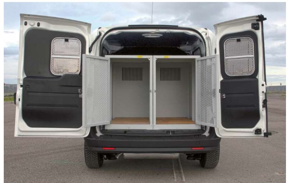
Allestimento Unità Cinofila su MPV con modulo da 2 gabbie