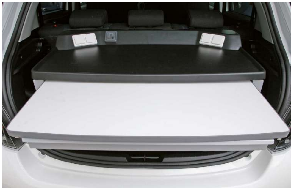
Piano scrittoio estraibile

Completa l'allestimento una pratica cassetteria per la modulistica posizionata sotto lo scrittoio. La struttura, composta dal ripiano fisso con scrittoio e cassetteria, può essere ruotata verso l'alto in modo da facilitare l'utilizzo del vano bagagli.