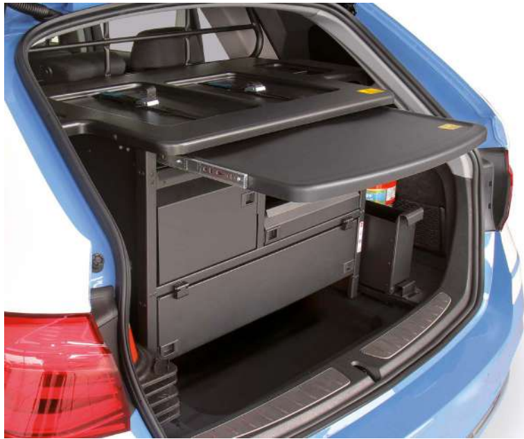
Piano scrittoio estraibile e alloggiamenti per stampante e notebook

Il ripiano fisso è dotato di apposite predisposizioni per l'alloggiamento di computer portatile e stampante oltre che di un pannello di comando per alimentazione elettrica, mentre il cassetto estraibile, con alimentatore incorporato e chiusura a sgancio, consente di utilizzare in sicurezza l'etilometro. Completano l'allestimento il piano scrittoio estraibile e il vano porta segnaletica.