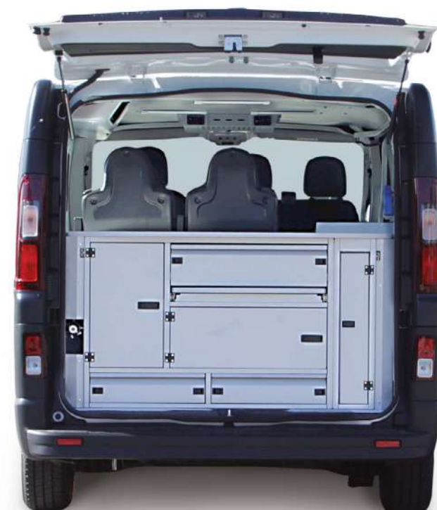
Vano tecnico realizzato su misura per il posizionamento di equipaggiamenti e attrezzature