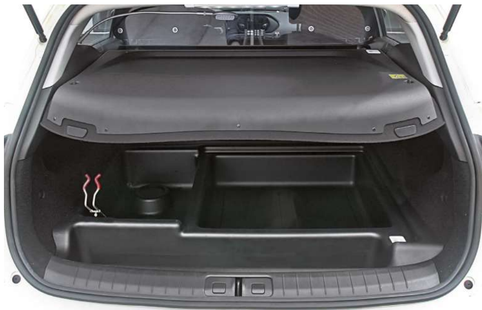
Piano scrittoio integrato in sostituzione della cappelliera originale e trunk organizer in ABS