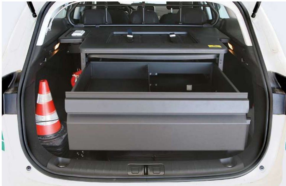
Cassetto con chiusura di sicurezza